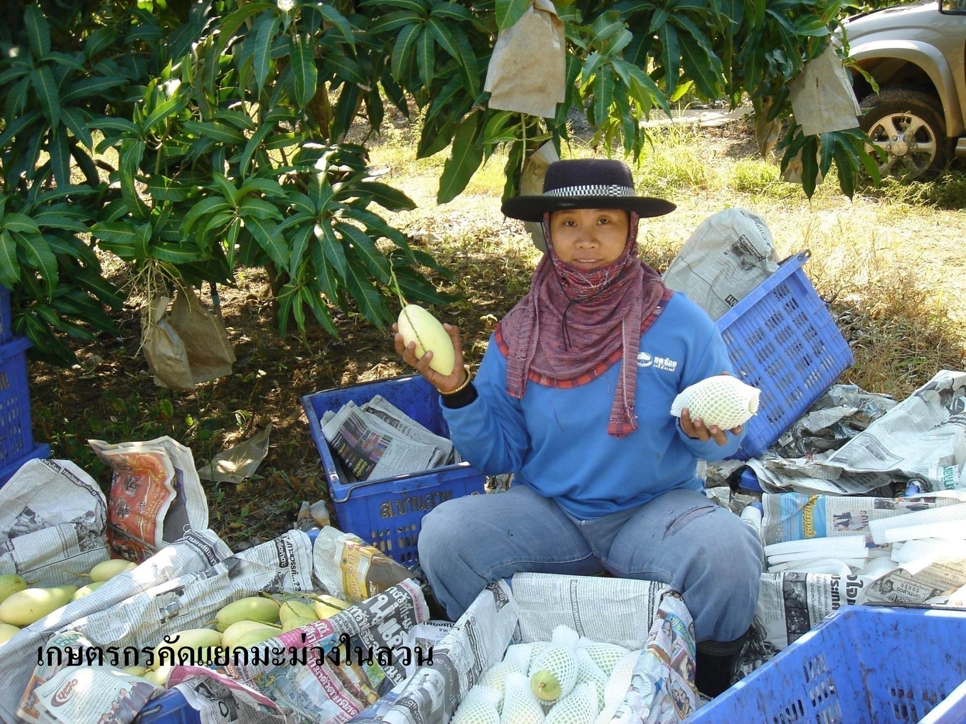
เกษตรกรคัดแยกมะม่วงในสวน