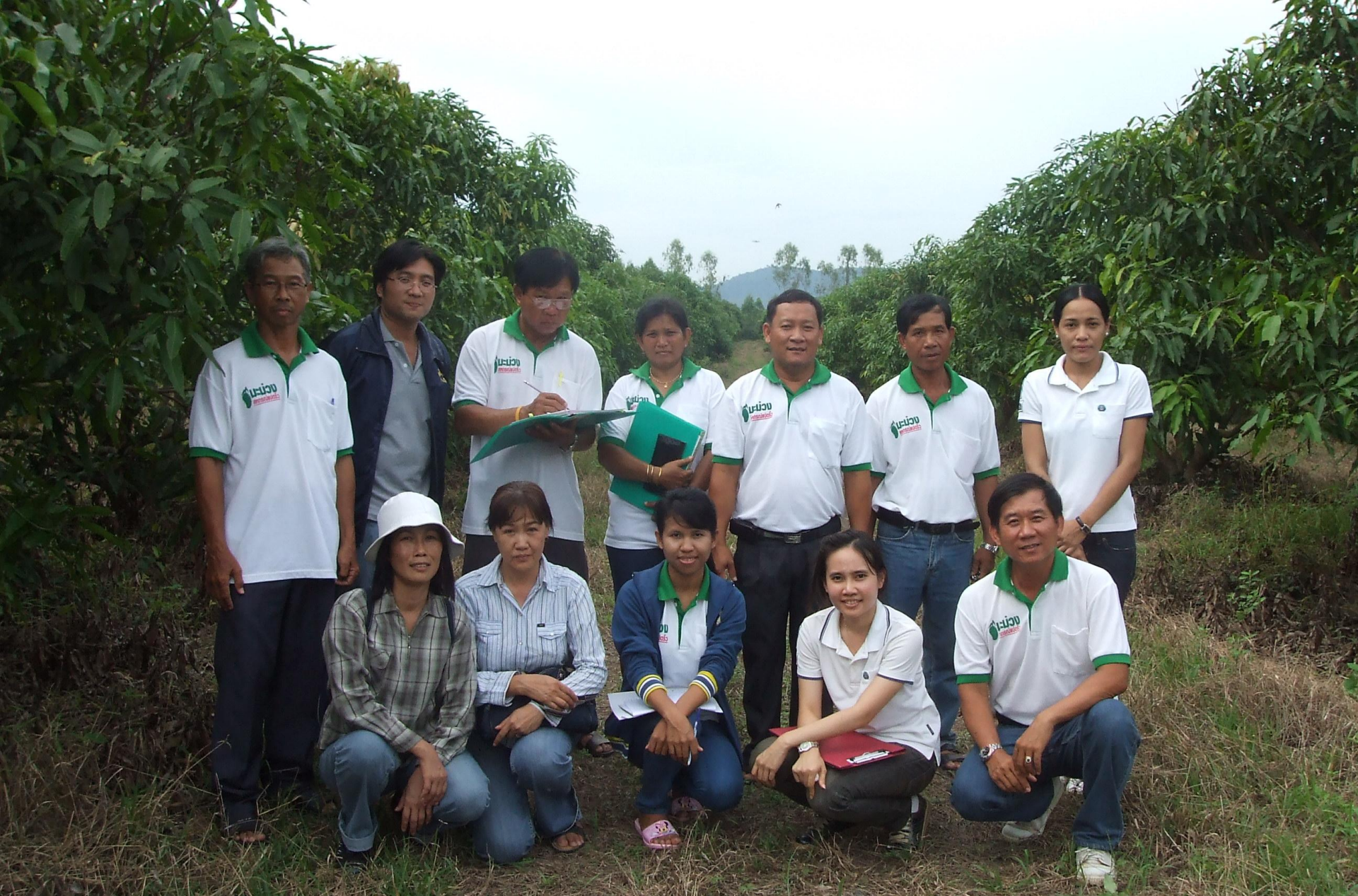
สมาชิก GAP กลุ่ม ของสหกรณ์